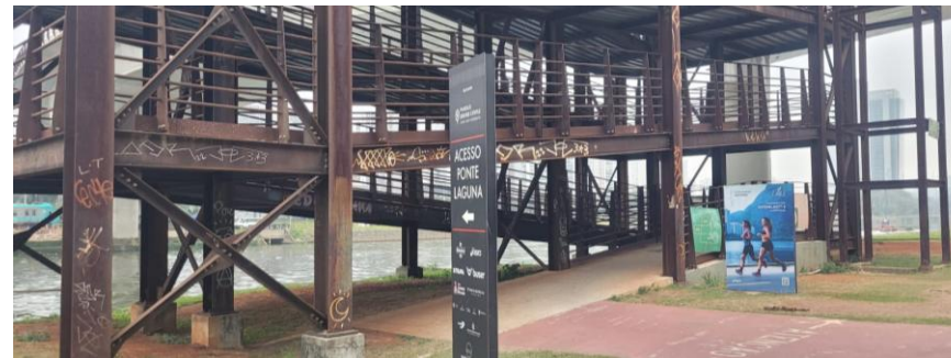
ACESSO PONTE LAGUNA