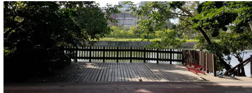
MIRANTE POMAR URBANO